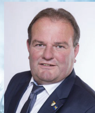
Erich Zeiler Vizebürgermeister