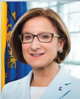
Johanna Mikl-Leitner Landeshauptfrau