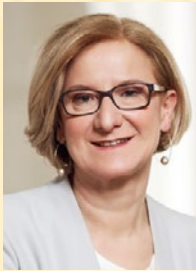
Landeshauptfrau Johanna Mikl-Leitner