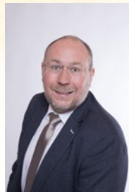
Bürgermeister Thomas Ludwig