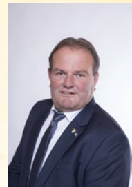
Vizebürgermeister Erich Zeiler